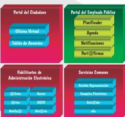
G-DATA: Herramienta de Administración